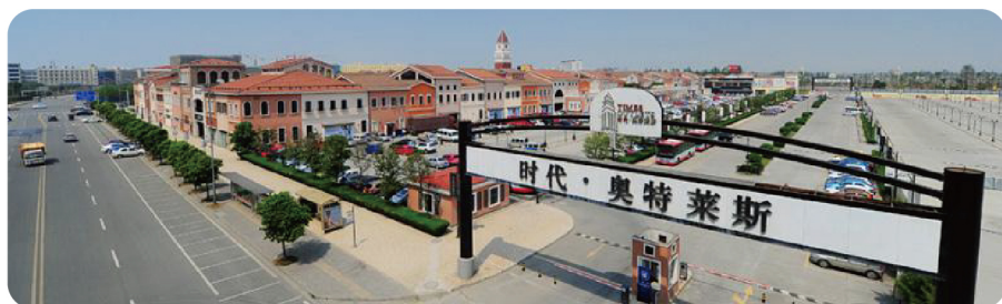
成都商业中心 – 双流奥特莱斯视频监控项目