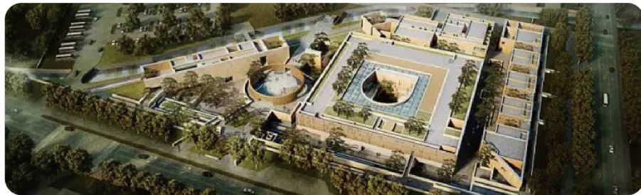
历史文化名城 – 承德市博物馆监控项目