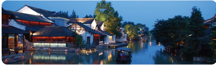
世界互联网大会永久会址 – 乌镇景区视频监控项目