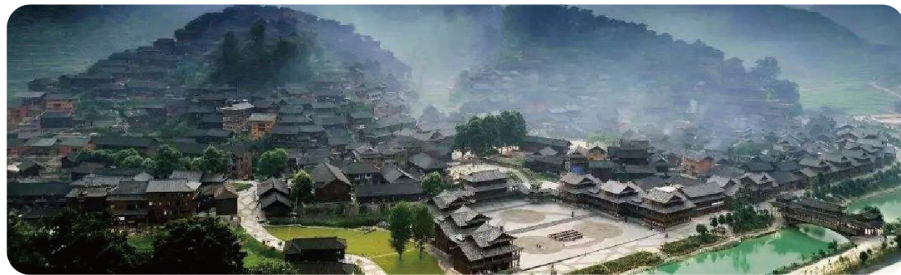
红色旅游胜地 – 遵义古城智能化项目