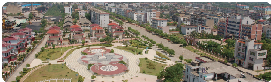
“丰樟高”经济圈中心 – 高安八景镇雪亮工程项目